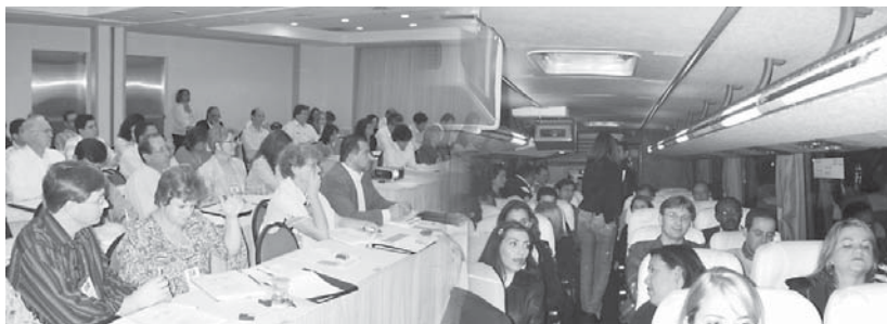
Imersão: Pessoal nas palestras e no ônibus para o teatro: trabalho, lazer e convivência

A falta de cursos curtos e específicos de capacitação e treinamento de gestores, reitores, pró-reitores, diretores de faculdade, coordenadores de cursos, chefes de departamento, diretores de área e da administração, que também precisam conhecer a gestão acadêmica, para melhorar cada vez mais a qualidade dos recursos humanos responsáveis pela gestão e direcionamento da instituição, levou a Lobo & Associados a criar sua unidade de cursos e treinamentos.