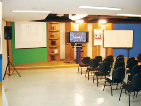
Um dos estúdios onde os cursos da L&A serão realizados e transmitidos ao vivo para todo o Brasil

nas principais cidades do País, com o material didático disponível pela internet, já incluso no valor do módulo.