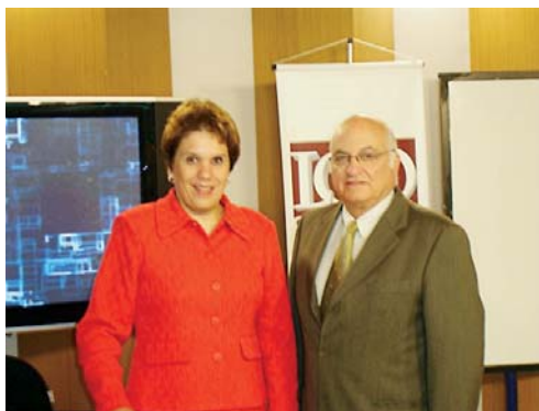
Diretores da L&A na Apresentação Piloto

Uma novidade interessante do Módulo 1 será a aplicação, ao vivo, de teste sobre liderança (que aponta como os subordinados vêem seu chefe) e sobre solução de conflitos (que mostra as diferentes formas de uma chefia intermediar um conflito, fato corriqueiro na vida dos gestores), cujo material e apostila com os resultados e os perfis serão enviados para que todos os participantes possam conhecer seu estilo de gestão de forma lúdica e, ao mesmo tempo, bastante dirigida para a realidade das IES.