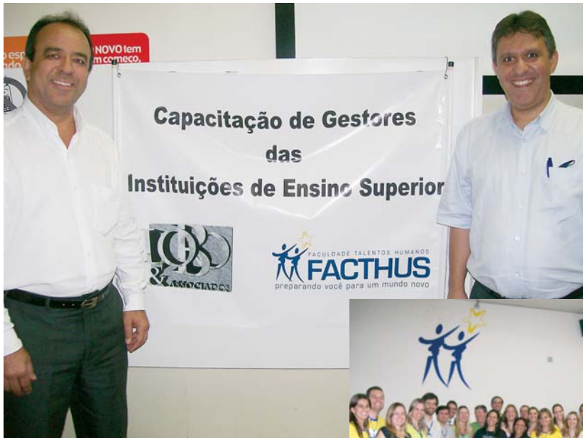
FATHUS: formando um time vencedor

O desafio de implantar simultaneamente 23 pontos de EAD telepresencial