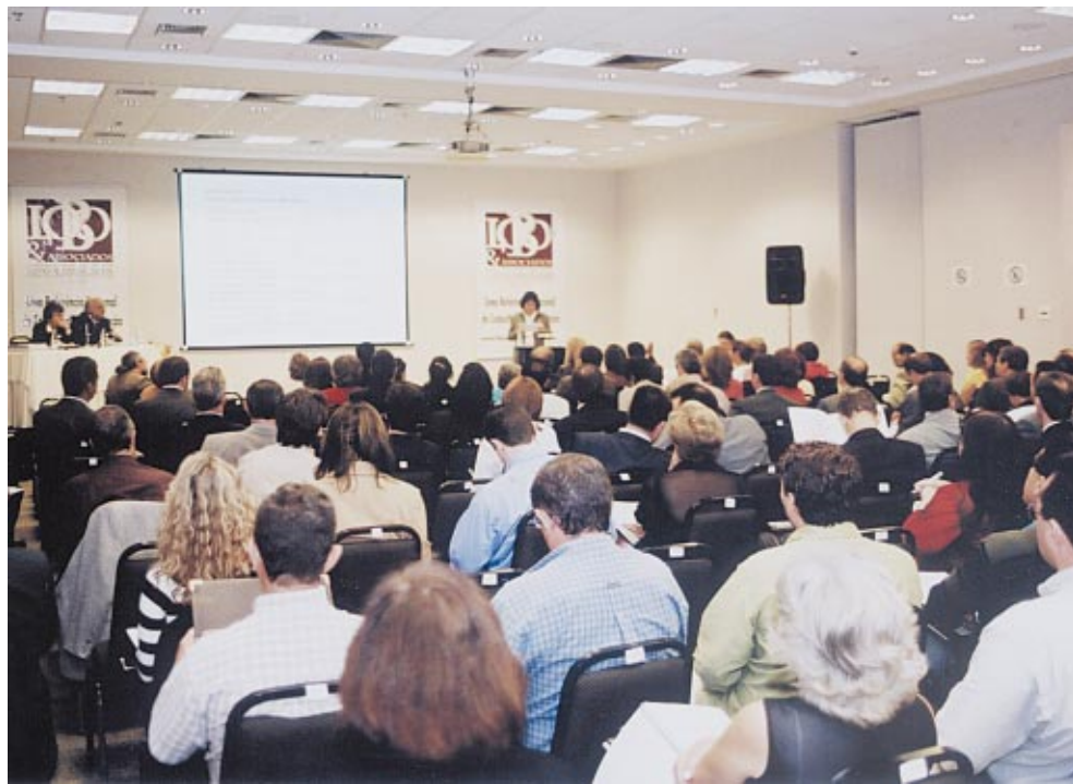
A pesquisa apresentada durante o Seminário, em junho, é o segundo levantamento exclusivo da Lobo & Associados

Realizados desde 1999, os seminários da Lobo & Associados abordaram, inicialmente, alguns pilares da gestão universitária: Unidade Acadêmica, Pesquisa, Pós-Graduação, Avaliação, Planejamento, Marketing, Extensão, Área Financeira, entre outros. Em todos eles, há implicações com o corpo docente, considerado um assunto transtematizado, porque tem relação direta com praticamente todas as outras áreas, o que gerou a escolha do tema para o mais recente evento nacional realizado, apoiado pelo sucesso da Pesquisa com as instituições.